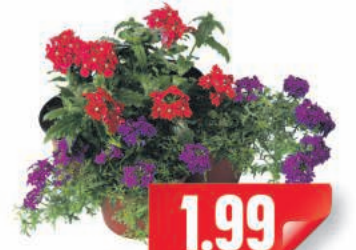
Petunien verschiedene Farben, Topf