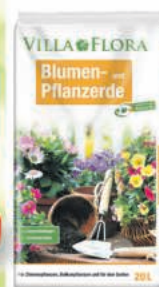
Villa Flora Blumen-erde 20-L-Sack (1 L = € 0,15)