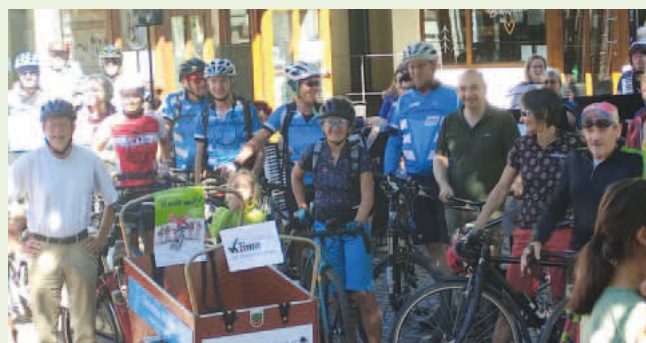
Teilnehmer der Radtour 2022, Bild: Gemeinde Buchenbach

Die Radtour zum STADTRADELN startet am Samstag, den 24. Juni 2023. Um 9.30 Uhr starten die Radler aus Stegen und werden gegen 9.45 Uhr vor dem Rathaus Buchenbach eintreffen. Bürgermeister Ralf Kaiser wird alle empfangen. Danach geht die Fahrt zusammen weiter nach Kirchzarten. Dort wird der Akkordeonclub Kirchzarten uns musikalisch bei einem Radlergetränk empfangen.