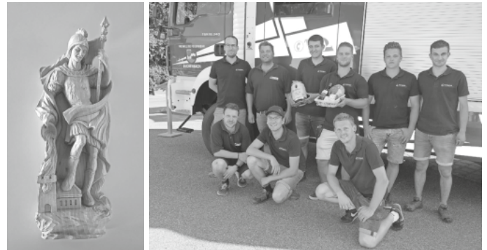
Auf den Bildern ist die Sieger-Trophäe und die Mannschaft der FFW Buchenbach zu sehen