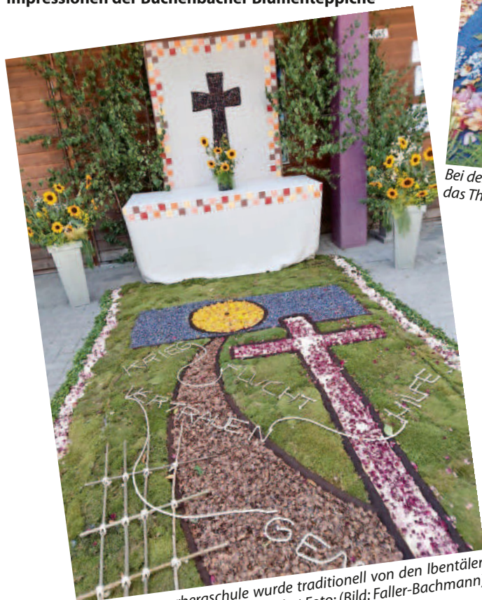
Bei der Sommerbergschule wurde traditionell von den Ibentäler Frauen ein Blumentepich gestaltet