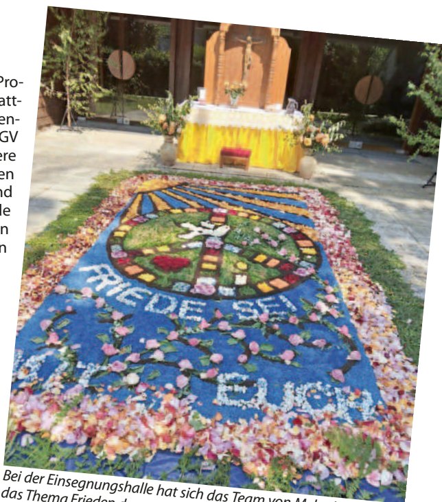
Bei der Einsegnungshalle hat sich das Team von Melanie Rombach das Thema Frieden dargestellt