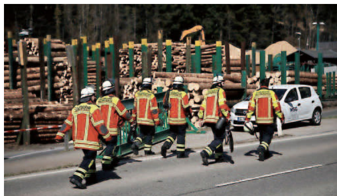
Impressionen des Einsatzes beim Sägewerk Dold.