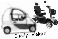
Charly - Elektro

Tullastraße 6 · 79341 Kenzingen 07644-92179-21 · www.leichtmobile.de